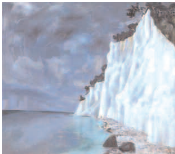
Caspar David Friedrich (1774- 1840)

Las posturas románticas acerca de la religión son variadas. No obstante, en general la creencia no la fundan los románticos en ninguna norma establecida, en ninguna moral instituida sino en un sentimiento interior que establece la comunicación entre el individuo y el universo, una intuición esencial de lo divino que conduce a una unión mística con Dios.